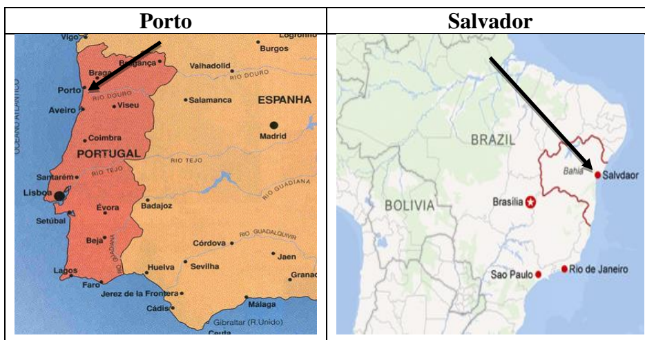
Fig. 1 - Localizações do Porto e Salvador

Salvador é a capital do estado da Bahia/Brasil, fundada em 1549, e foi a primeira capital do país até 1763, quando esta foi transferida para o Rio de Janeiro. Salvador é uma metrópole nacional com, aproximadamente, 3,0 milhões de habitantes, sendo o município mais populoso do Nordeste, a terceira cidade mais populosa do Brasil, abaixo de São Paulo e Rio de Janeiro, tendo 706,8 km 2 de área. As belezas naturais e os sítios históricos, que se desenvolveram ao longo de seus 467 anos, fazem do turismo sua principal fonte de renda. Sua Região Metropolitana, conhecida como "Grande Salvador", possui 3,5 milhões de habitantes, o que a torna a terceira mais populosa do Nordeste, sétima do Brasil e uma das 120 maiores do mundo (PMS, 2015). Na Figura 1 são mostradas as localizações das duas cidades.